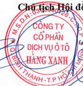
ĐỖ TIẾN DŨNG